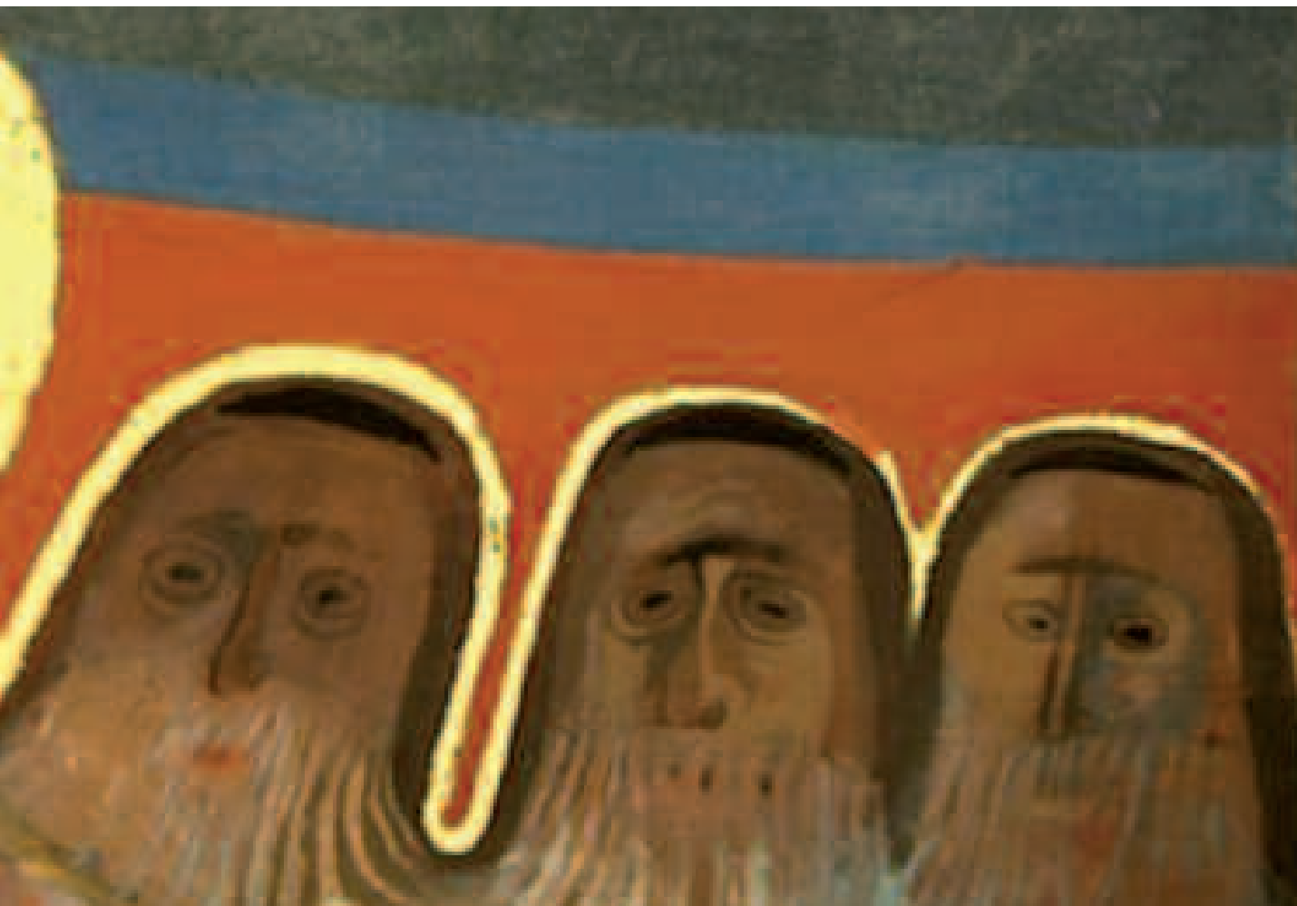
Jésus parmi les docteurs/ Gesù tra i dottori

Palazzo arcivescovile di Malines - Bruxelles